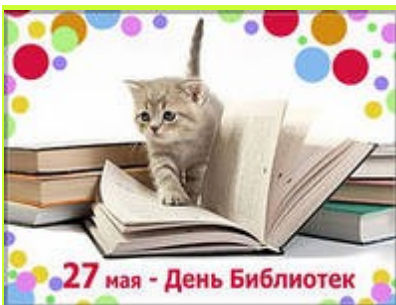
27 мая - День Библиотек

Сегодня так развит цифровой мир, что он кажется почти реальным, но все равно, ничто не заменит бумажную книгу! Толстую или тонкую, новенькую, с запахом типографской краски или старинную, в хрупком переплете... Хотим поздравить вас, библиотекаря, хранителя лучших книг, с профессиональным праздником и пожелать всего наилучшего!